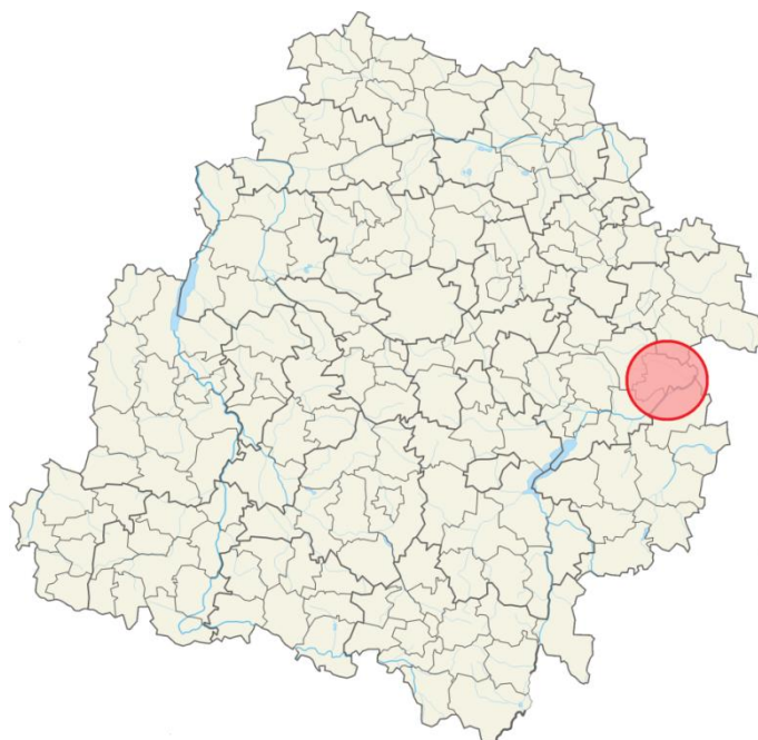
Rys. Lokalizacja gminy Rzeszyca na terenie województwa łódzkiego

Przedmiotem zamówienia określonym w niniejszych wymaganiach jest wykonanie dokumentacji projektowej oraz robót związanych z zadaniem inwestycyjnym: Przebudowa drogi gminnej nr 116111E wraz z przebudową wiaduktu w miejscowości Jeziorzec.